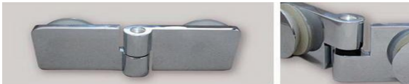
Hebe-Senk Scharnier Glas/Glas 180° links (Schaubsystem)